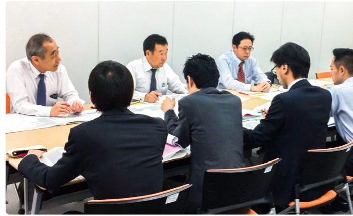
設計業務の指導・調整