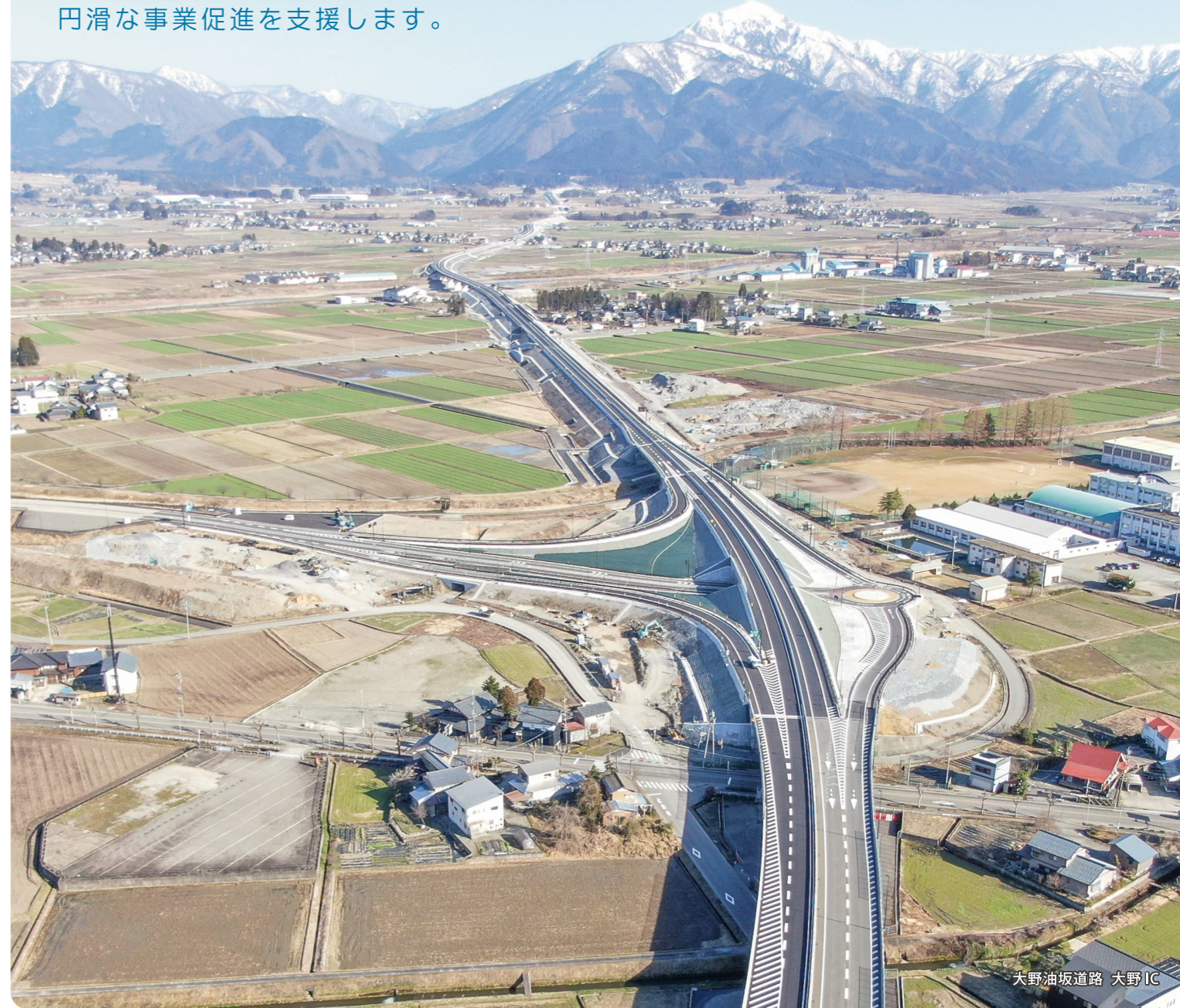
大野油坂道路 大野IC

事業化後・工事着手後の業務を進める上で 解決すべき課題がたくさんあります。 長年の経験で培った確かな技術と知識で 円滑な事業促進を支援します。